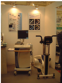
「第43回日本リハビリテーション医学会学術集会 /フクダ電子殿展示ブースにて」 ストレングスエルゴ8とML9000の接続状態の展示

②「ストレングスエルゴ240」を併設展示致しました。又フクダ電子殿展示ブースにて「ストレングスエルゴ8」を展示致しました。ご来場の方々にも試乗して頂き、非常に好評でした。