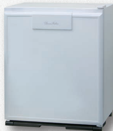
形名:RD-40B-W パールホワイト