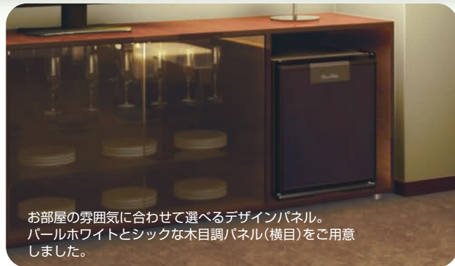
お部屋の雰囲気に合わせて選べるデザインパネル。パールホワイトとシックな木目調パネル(横目)をご用意しました。

奥行きが深い庫内およびドアポケットに収納できる40Lタイプ。ドアポケットは透明で、飲料品を広々とみせることができます。保湿性を活かして、ウェルカムフルーツなどをお客様にご提供することも。